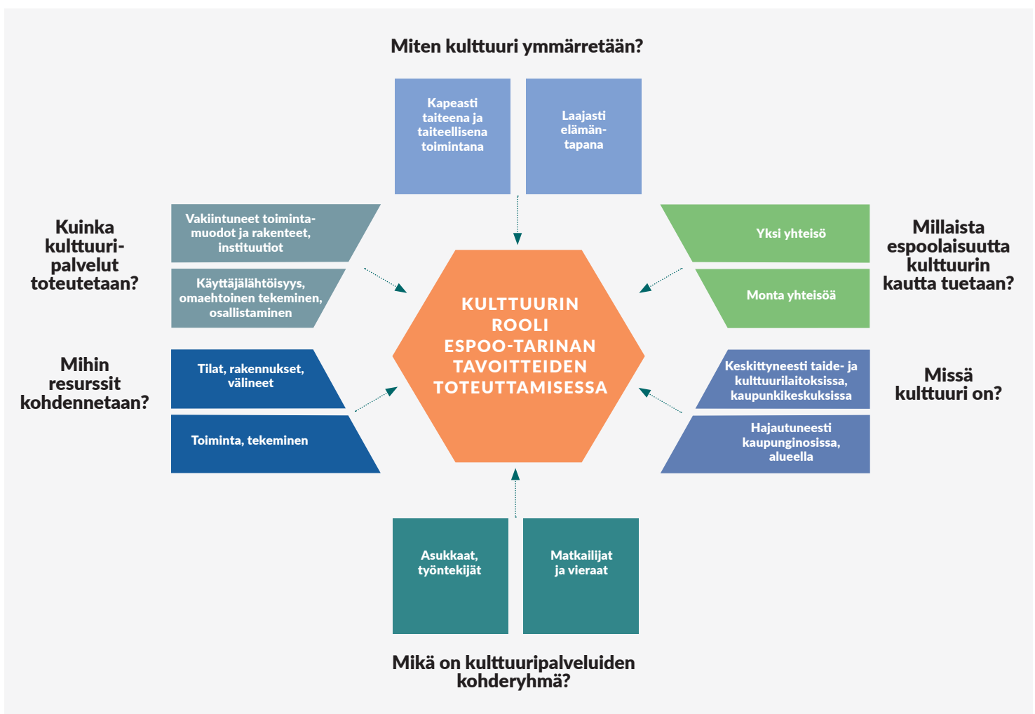
Kuvio 1. Kulttuuri ja kaupunkikehitys. 3