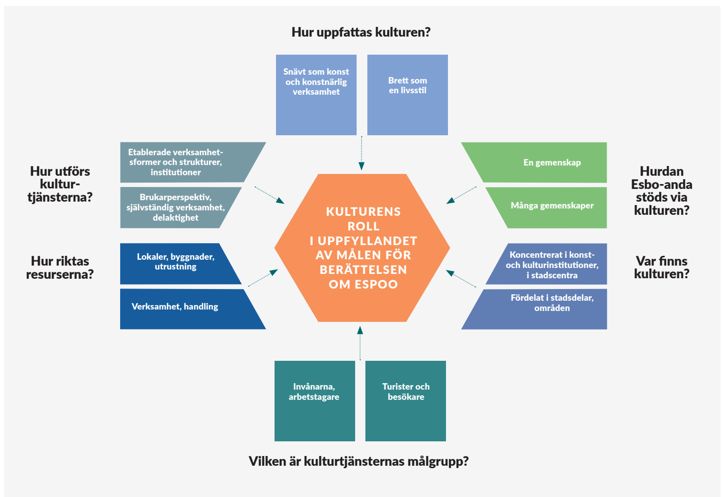
Figur 1. Kultur och stadsutveckling 2